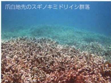
爪白地先のスギノキミドリイシ群落