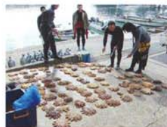
●オニヒトデの駆除活動