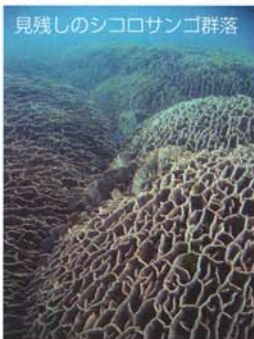
見残しのシコロサンゴ群落

黒潮の影響により温暖な足摺宇和海国立公園の海は本土海域屈指のサンゴの生息地です。その中でも、竜串湾は特に美しい海中景観を持つことで知られています。湾内には竜串海中公園地区として4区域（爪白・竜串・大濠・見残し）が指定されており、イシサンゴ類をはじめとした豊かな海洋生物が息づいています。