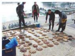
●オニヒトデの駆除活動