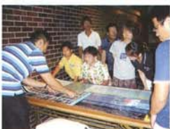
●サンゴに関する住民勉強会

豊かなサンゴの海を守るには、海だけでなく山や川、里の環境もよくしていかなければなりません。竜串のすばらしさをもっと多くの人に知ってもらうことが、その第一歩です。